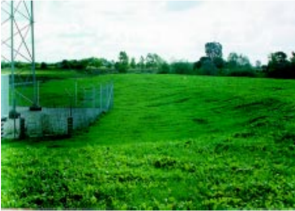
Zrekultywowane stare wysypisko śmieci.

W ciągu kadencji obecnej rady miejskiej założono i zmodernizowano oświetlenie uliczne w miejscowościach: Dzbańdz, Chelsty, Prycanowo, Dyszobaba, Podborze i Załęże oraz wybudowano trzy przystanki autobusowe w Dzbańdzu i Załużiu. Zmodernizowano na system olejowy ogrzewanie budynku Urzędu Gminy zainstalowano sieć