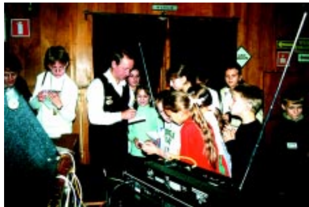
Andrzej Rosiewicz w GOUK 28.10.2001r.

Budując i rozbudowując infrastrukturę wodociągową nie zapomniano o kanalizacji. Uzbrojono w nią ulicę Polną i Słoneczną, poprawiono na ulicy Fortowej, gdzie zainstalowano przepompownię. Łącznie wykonano 1,1 km kanalizacji. W planie na br. jest skanalizowanie ulic Poniatowskiego, Panny Marii i Czystej.