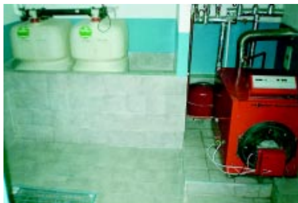
Nowoczesna, ekologiczna, olejowa kotłownia w budynku Biblioteki Publicznej.

czeń. Czekają jeszcze remont sali widowiskowej, który być może rozpocznie się już w tym roku. Gościli w Różanie znani artyści i piosen-