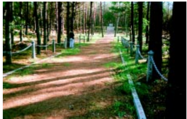
Cmentarz wojskowy w Kaszewcu.

Obecna rada miejska zakończyła definitywnie trwający od kilku lat konflikt społeczny i utworzyła sołectwo Paulinowo. Odnowiono pomnik pomordowanych mieszkańców Różana w 1920 roku na cmentarzu parafialnym. Wyremontowano stary cmentarz wojskowy w Kaszewcu. Wreszcie w tym roku zażegnano trudną sytuację związaną z płatnościami na rzecz gminy za składowanie odpadów promieniotwórczych, o czym donosił nr 5-6/2002 Świerszcza Różańskiego. Nie zapomniano również i poczyniono starania o pozyskanie środków spoza budżetu gminy na budowę zbiornika retencyjnego na Różanicy, którą zapoczątkowała poprzednia rada /kosztorys i dokumentacja/, jednak jak na razie nie przyniosły one wymiernych efektów. Inwestycja ta, której koszt łącznie z wykupem gruntów przekracza cały roczny budżet gminy, może być wykonana jedynie przy wsparciu finansowym np. ze środków unijnych, o które w dalszym ciągu gmina zabiega.