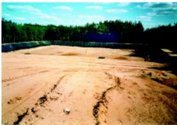
Wysypisko śmieci w budowie.

Z roku na rok remontowano i finalizowano budowę dróg gminnych, których łącznie wykonano 8,1 km. Wyasfaltowano drogę we wsi Dyszobaba. Oddano rozpoczętą przez poprzednią radę budowę ronda na drodze krajowej w Różanie. W kosztach inwestycji, która zamknęła się sumą ok. 800 tys. zł partycypowała gmina w ponad 310 tys. zł, a pozostała kwota finansowana była przez Dyрекcję Rejonowych Dróg Publicznych w Warszawie. Sporo wysiłku włożono również w celu pozyskania środków na sfinalizowanie budowy powiatowej drogi do Chelst w kwocie 140 tys. zł z przedsiębiorstwa EuroPolgaz. We wrześniu br. zostanie również asfaltowana powiatowa droga Szygi-Ponikiew, w której gmina ma swój udział w kwocie 30 tys. zł. W kadencji obecnej rady zmodernizowano także drogi gminne do miejscowości Kaszewiec i Mroczi z dofinansowaniem ze środków Urzędu Marszałkowskiego oraz we wsi Dyszobaba. Zmodernizowano ul. Polną, która być może wreszcie przestanie być zarzewiem różnorodnych konfliktów społecznych. Położono asfalt w ulicy Poniatowskiego. Pojawiły się nowoczesne chodniki z kostki brukowej na ulicach Gdańskiej, Sienkiewicza, Kilińskiego, 3 Maja, Cmentarnej, Warszawskiej, Poniatowskiego i Zjazd. Obecnie trwają prace przy modernizacji nawierzchni i skorygowaniu spadków na Pl. Obrońców Różana i ul. Sienkiewicza. Planowane jest również w br. zmodernizowanie nawierzchni ulic Gdańskiej i Czystej oraz drogi gminnej w Załęzach-Eliaszach.