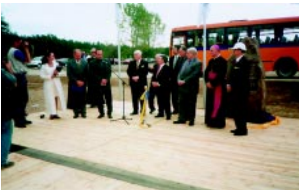
Moment przekazania autobusu do przewozu dzieci dla gminy Różan przez spółkę Europolgaz s.a. podczas otwarcia gazociągu Jamał - Europa Zach.

Już na samym początku kadencji awaria od lat nie konserwowanego ujęcia na Narwi spowodowała, że Różan został pozbawiony wody. Wybudowano wtedy w trybie pilnym 2 studnie głębinowe i magistralę wodociągową w kierunku Stacji Uzdatniania Wody. Dziś Różan może się pochwalić trzema studniami głębinowymi, sporą infrastrukturą wodociągową i znakomitą jakością wody. Powiatowy Inspektor Sanitarny wydał orzeczenie o przydatności wody i wodociągu publicznego na czas nieokreślony. Rozbudowano sieć wodociągową o ulice: Warszawska, Mostowa. Dokończono wodociąg w Podborzu, pojawiła się woda w Paulinowie, a już niedługo z wodociągowany