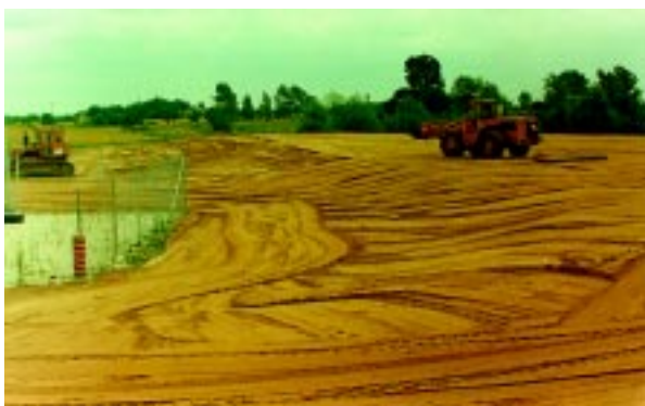
Prace przy rekultywacji starego wysypiska śmieci.