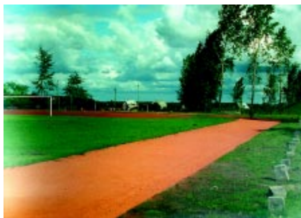
Remont stadionu.