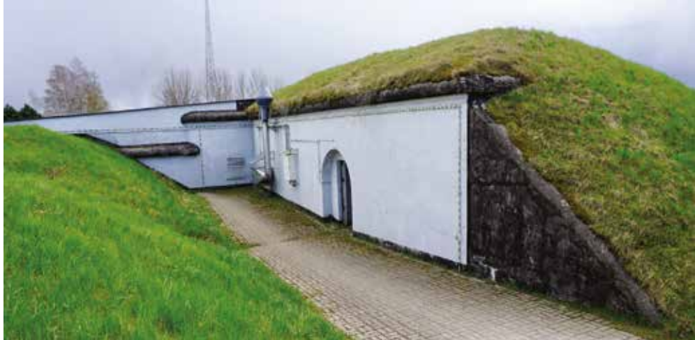
Przelotnia wyjścia bojowego ze schronem dla armat przeciwlotnicowych przy prawym barku fortu III

Krajowe Składowisko Odpadów Promieniotwórczych (KSOP) działa w forcie III do dzisiaj, mimo upływu 60 lat. Stanowi nie tylko relikty dawnej inżynierii wojskowej, bo właściwości taktyczno-techniczne zajętego dzieła budownictwa obronnego zdeterminowały sposób i zakres przechowywania substancji radioaktywnych. Jest także reliktem krótkiego czasu zarządu sprawowanego nad obiektem przez WP po roku 1945, z czego mało kto zdaje sobie sprawę. Numeracja zasadniczych betonowych kompleksów magazynowania 1, 2 i 3 wcale nie jest porządkiem ustalonym po osadzeniu tam składowiska przez jego organ kierowniczy. Przeniesiono ją z otrzymanej dokumentacji wojskowej. W ewidencji sporządzonej w roku 1949 po-