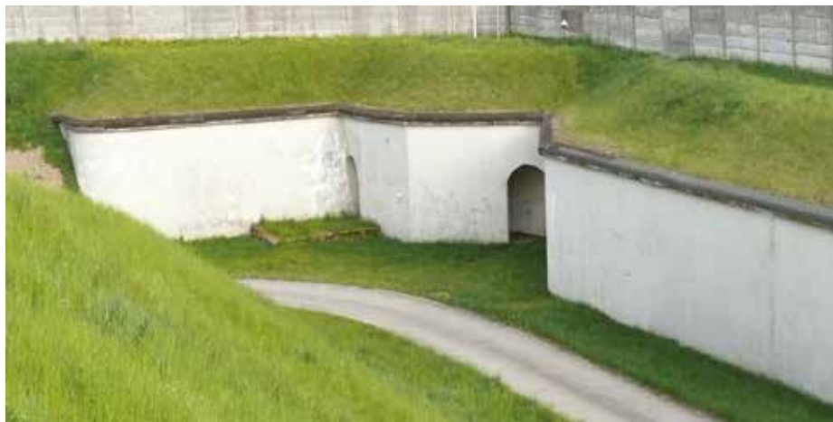
Podwójny kojec przeciwkarpowy fortu III (strzelnice zamurowane)