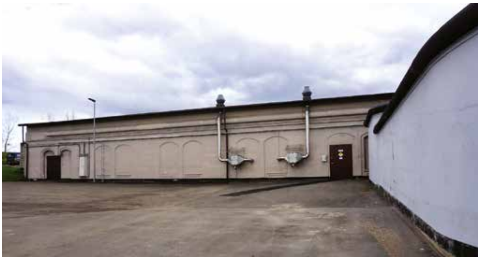
Widok ogólny frontowej ściany koszar sztyjowych fortu III w roku 2021. Od strony prawego barku widoczne jest nie zamurwane okno w latrynie. Na skrajach obu fotografii znajdują się ściany kaponier sztyjowej